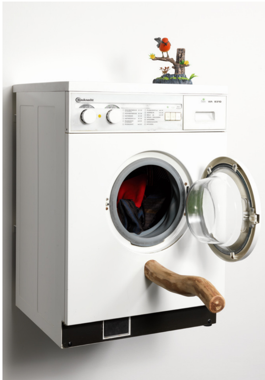
- kuckuck -