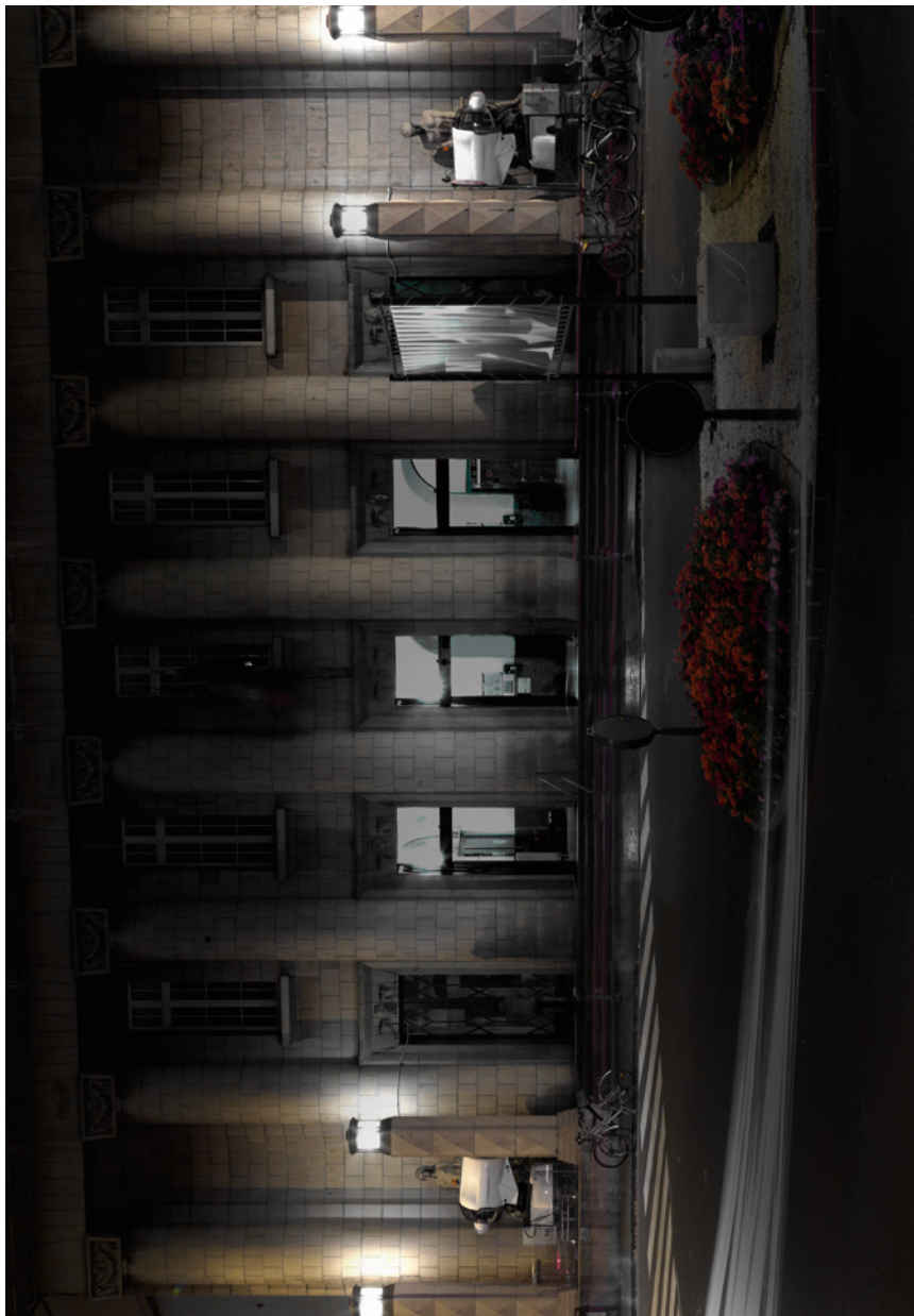
– stazione fs bolzano / bahnhof bozen –