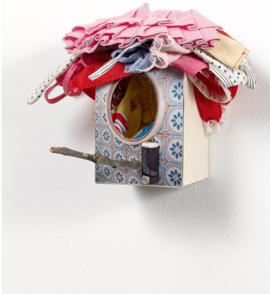
- madrid me mata -