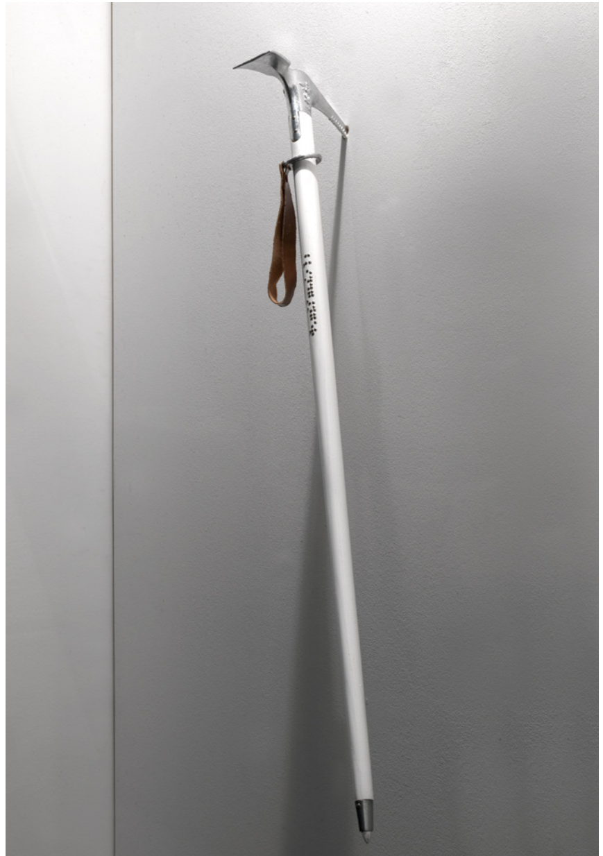
- blindgänger -