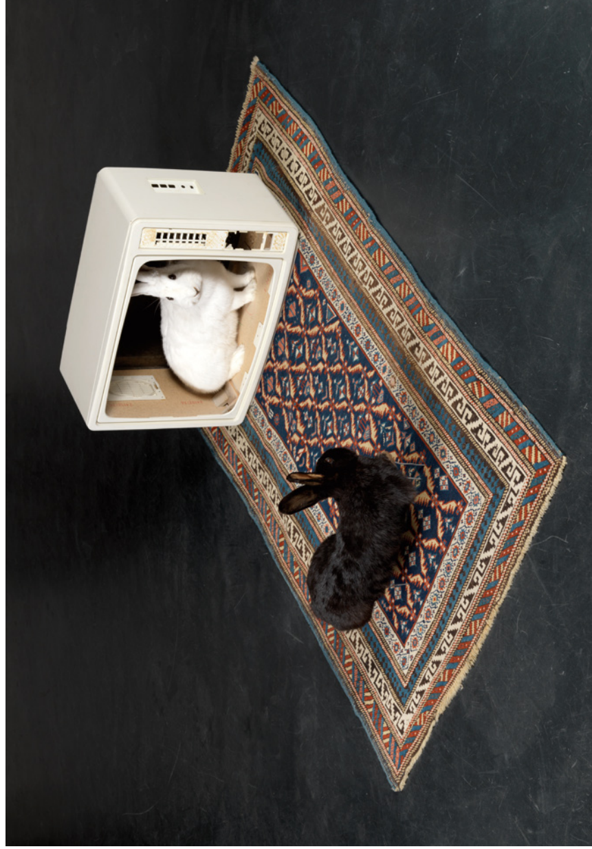
— saturday night fever —