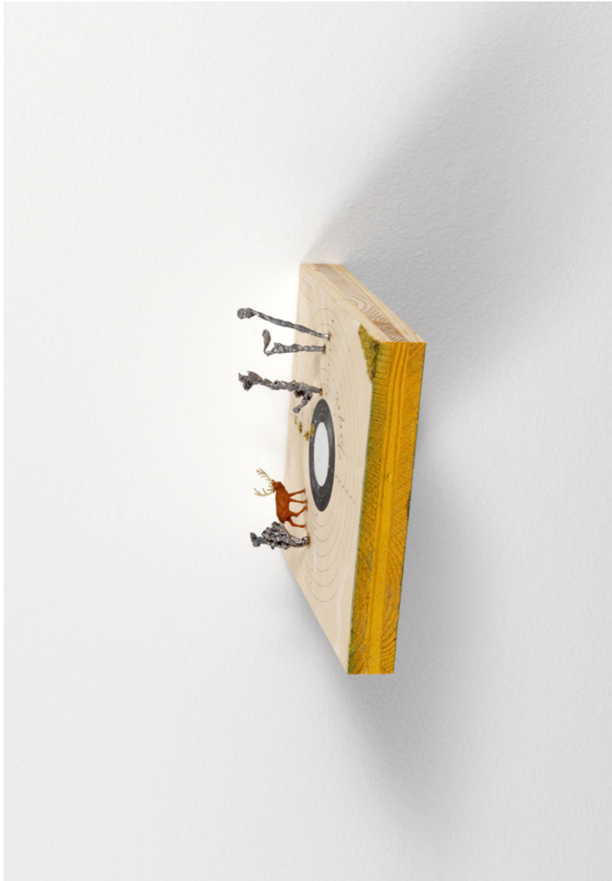
- platzhirsch -