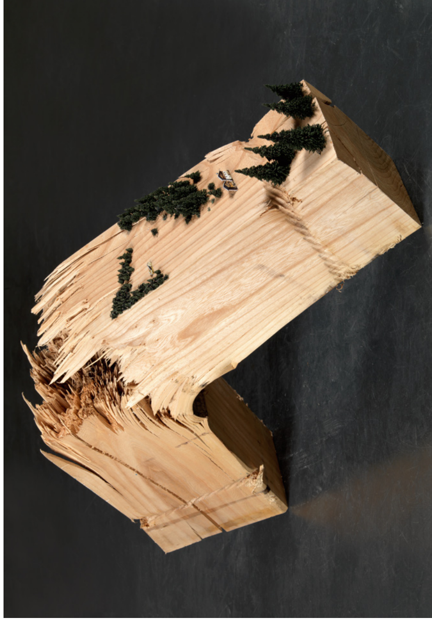
— dolomiten —