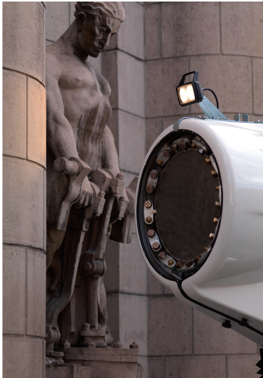
– sudator –