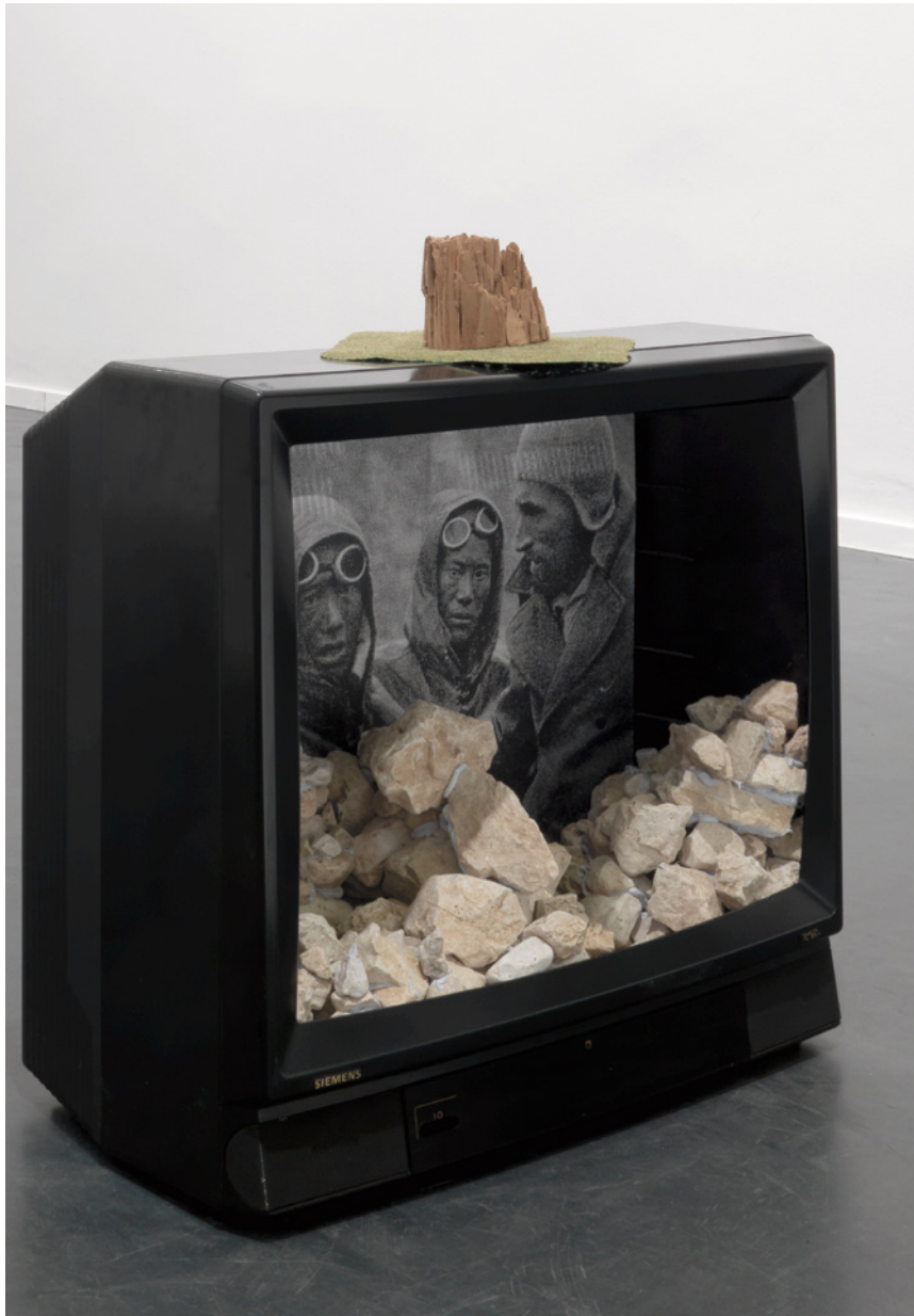
- bergfreunde -