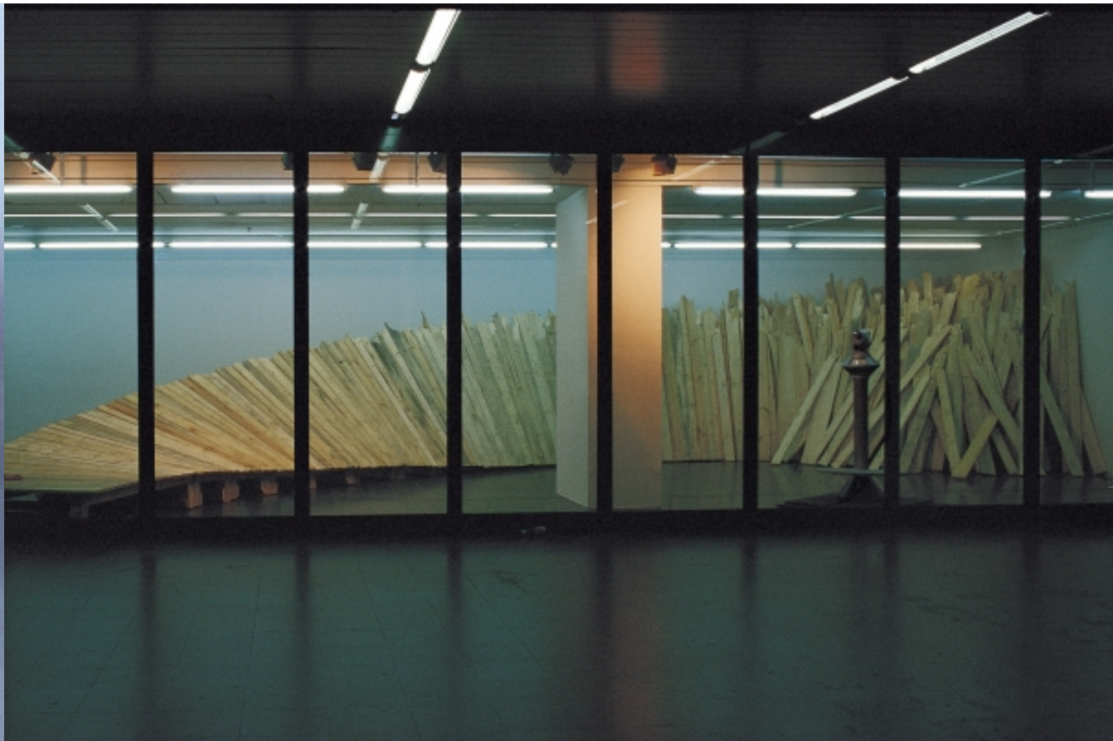
Hubert Kostner/Gregor Passens, Panorama 1999, Holz, Eisen, 1200 x 700 x 260 cm Installationsansicht AkademieGalerie, München